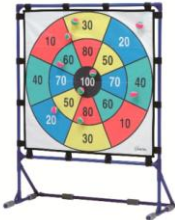
④ターゲットゲーム

期日 11月18日(日) 受付 12:30~ 開始 13:00~ 終了 15:30 場所 ひとり親家庭サポートセンター